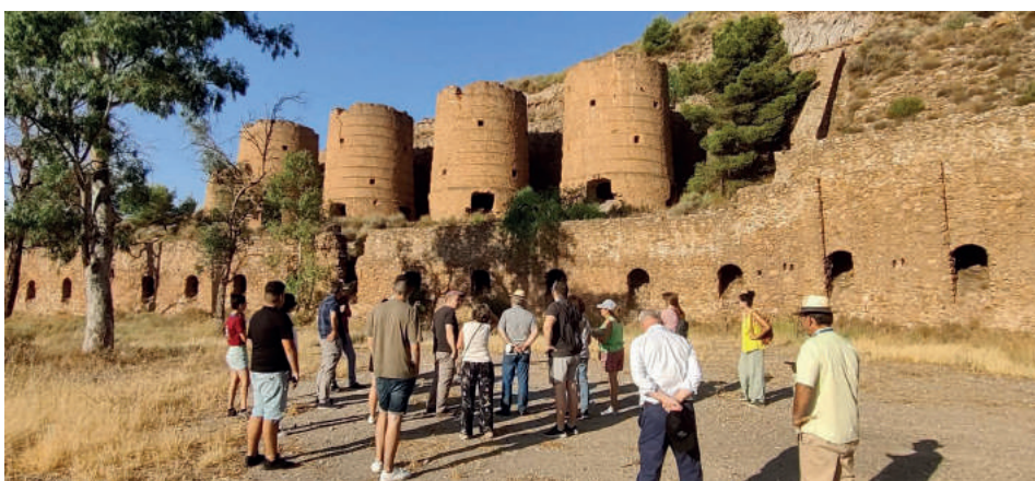
Ruta a la mina de los Tres Pacos del curso de la minería