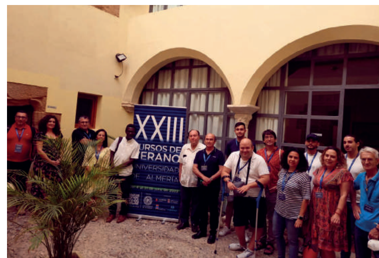
Foto de alumnado segundo curso de verano en Cuevas