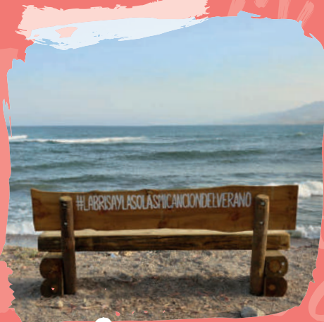
2 Bosque de Palomares