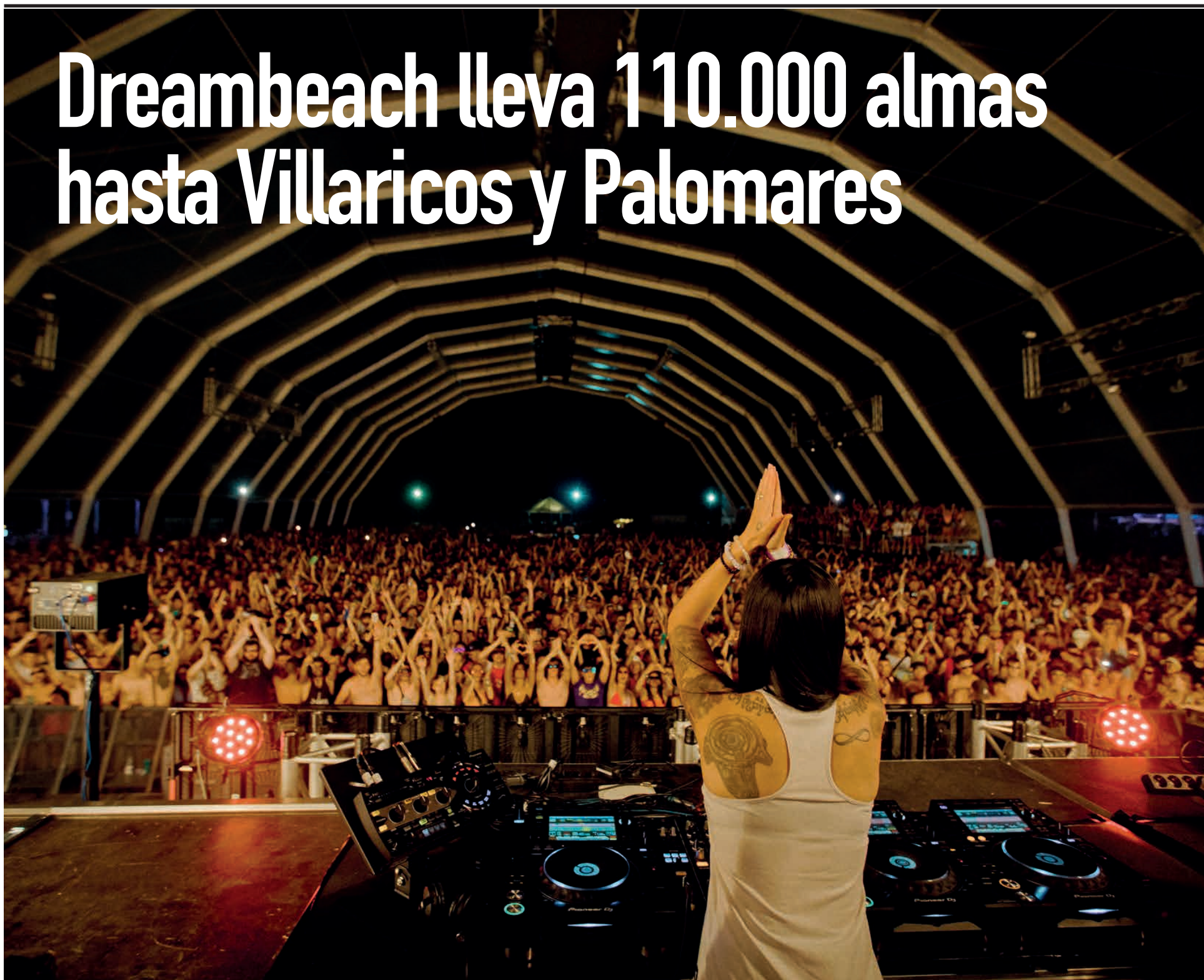
Dreambeach en las playas de Palomares y Villaricos en su edición del verano de 2022

El festival de música electrónica más importante de España retorna con ganas a la costa de Cuevas del Almanzora. PÁG 2