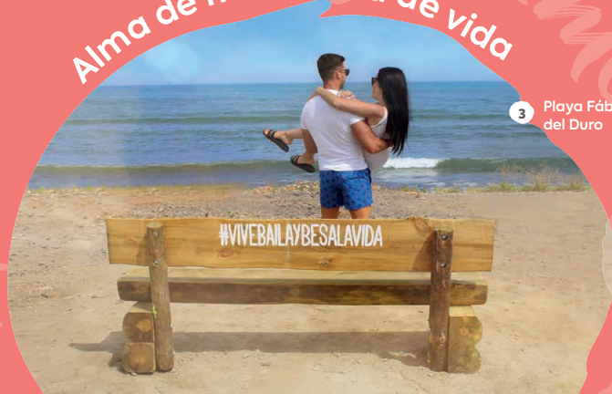
3 Playa Fábrica del Duro