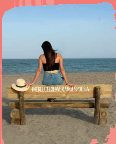
1 Playa de Quitapellejos

Descubre todo el mobiliario fotográfico que se ubica en nuestra costa