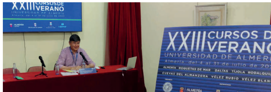
El exministro Manuel Pimentel en los cursos

Cuevas del Almanzora ha sido sede durante el mes de julio de dos de los cursos de verano de la UAL. En concreto, se desarrollaron los cursos 'Patrimonio minero. Memoria y recurso para el desarrollo local' y 'Yuder Pachá y la presencia hispana en la curva del Níger'.