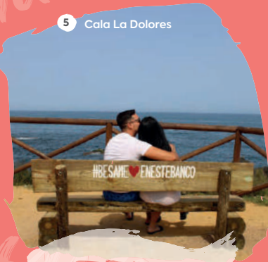
5 Cala La Dolores